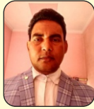
Ashok Kumar (Hindi)