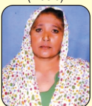
Chandervati (Water Women)